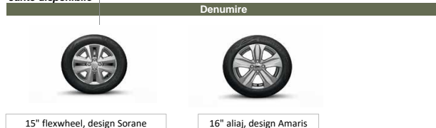
15" flexwheel, design Sorane